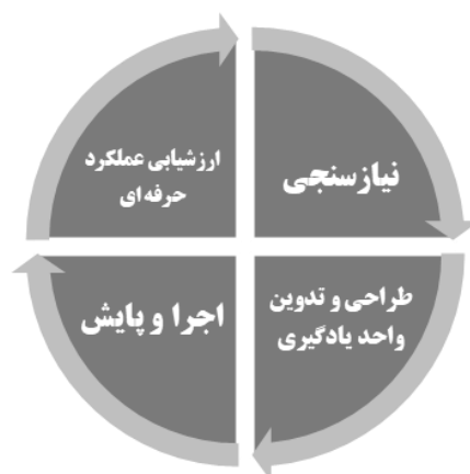
شکل شماره ۲: چرخه فعالیت کارآموزی

این فرایند شامل چهار مرحله است که عبارتند از: «نیازسنجی»، «طراحی و تدوین واحدهای یادگیری»، «اجرا و پایش» و «ارزشیابی عملکرد حرفه ای». شکل شماره ۱، چرخه فرایند کارآموزی را نشان می دهد: