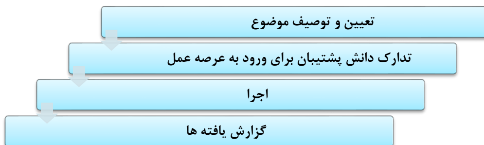
شکل شماره ۲: چرخه درس آموزش پژوهی در عرصه عمل

چرخه آموزش پژوهی ناظر به فرایند عمل و تامل بر آن که مراحل آن در شکل شماره ۲، نشان داده شده است: