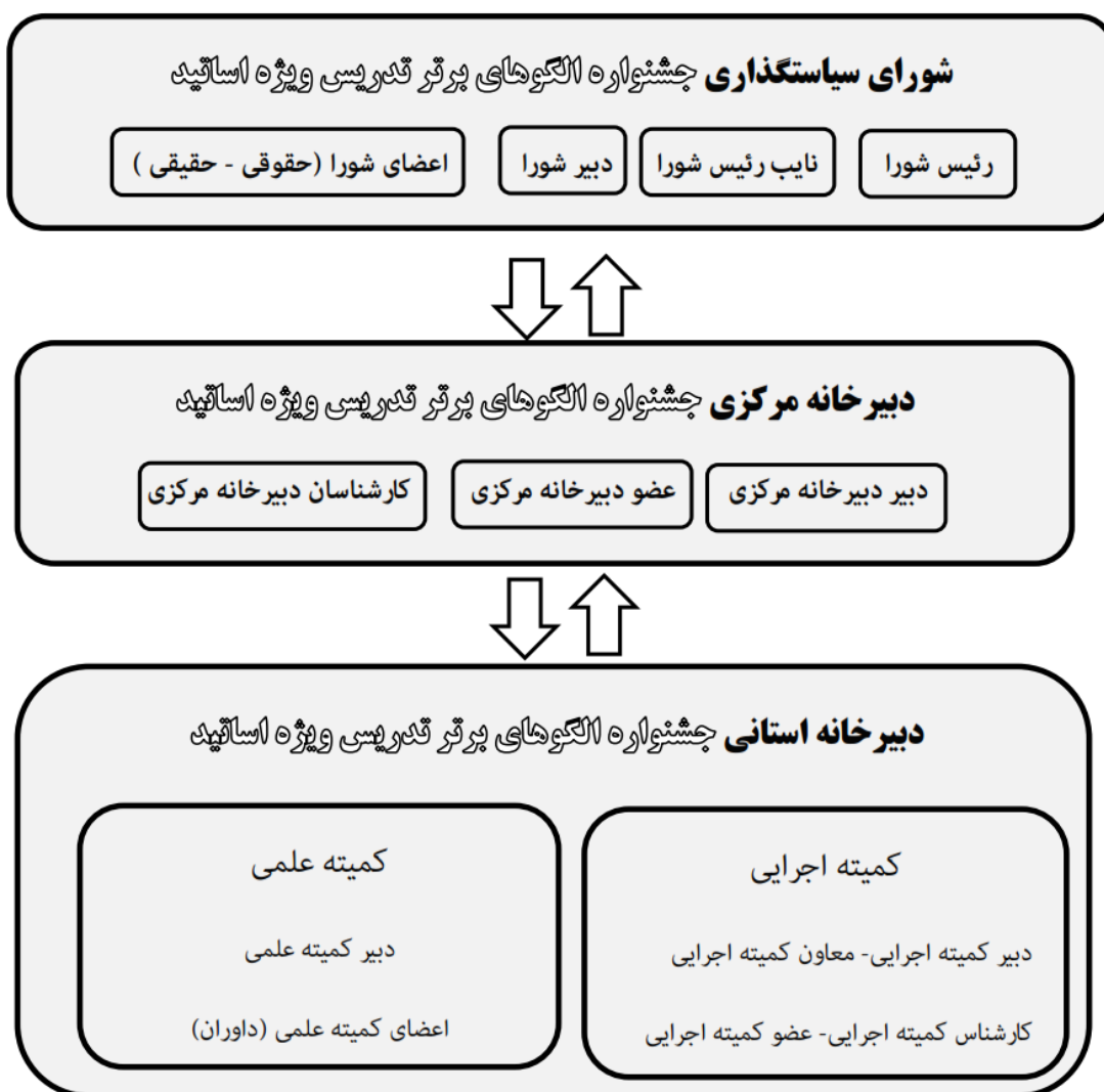
شکل ۱. چارت سازمانی جشنواره

ساختار جشنواره الگوهای برتر تدریس دانشگاه فرهنگیان ویژه اساتید، مطابق شکل ۱ در سه سطح شورای سیاستگذاری، دبیرخانه مرکزی و دبیرخانه استانی می باشد.